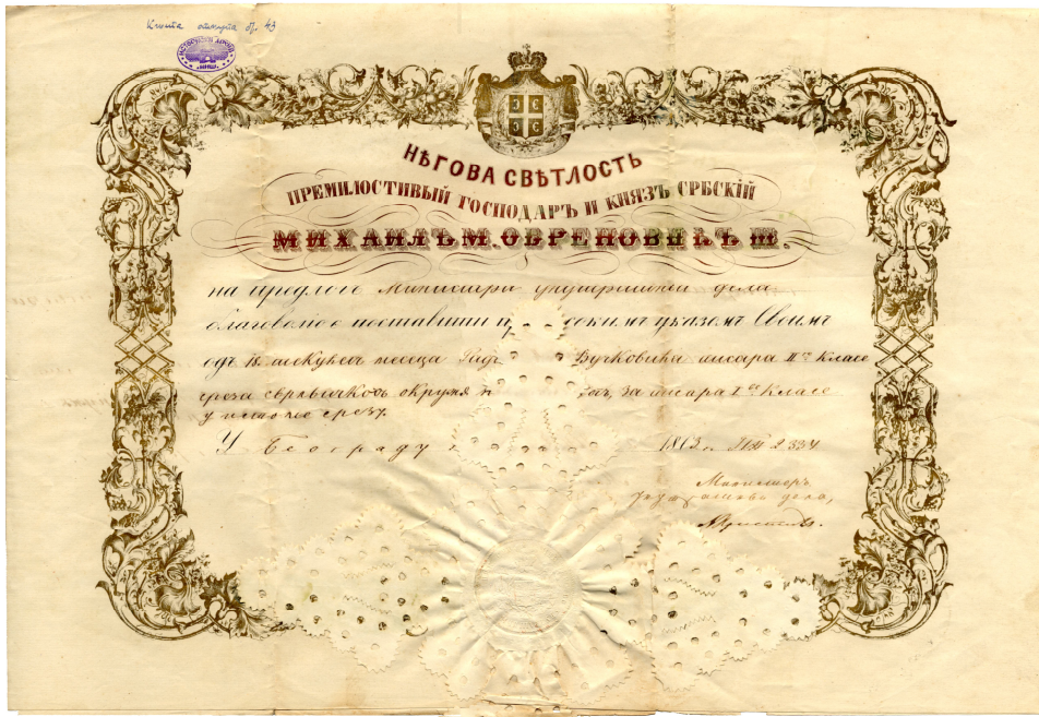
Указ Кнеза Милоша Обреновића о постављењу Радомира Вучковића за писара Среза Сврљшког (1859)

- Стара документа (1853-1915): укази, сведочанства, уверења, калфенска писма, плакати (В-16). Посебно се истичу сведочанства и калфенска писма која су израз правог богатства наше културе у смислу калиграфског исписивања текста. Присутно је и богатство орнаментике као украс сведочанства и еснафских писама, као и воштаних печата који су прави раритети;